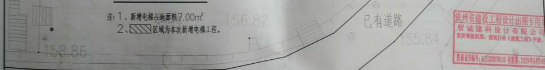
新增电梯位置 总平面示意图