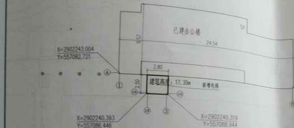
新增电梯位置 总平面示意图